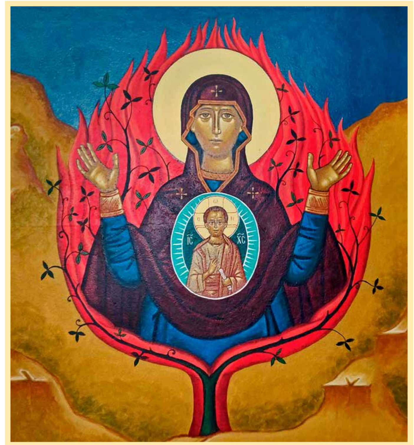
Ikoni Jumalanäiti Palava pensas Lammin Luostarikeskus Panagiasta.

Palava pensas taas säilyi vahingoittumattomana, vaikka tuli roihusi siinä. Palava pensas Neitsyt Marian ikonissa muistuttaa, että Maria oli nuori ja viaton.