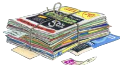
бумага, газеты, журналы