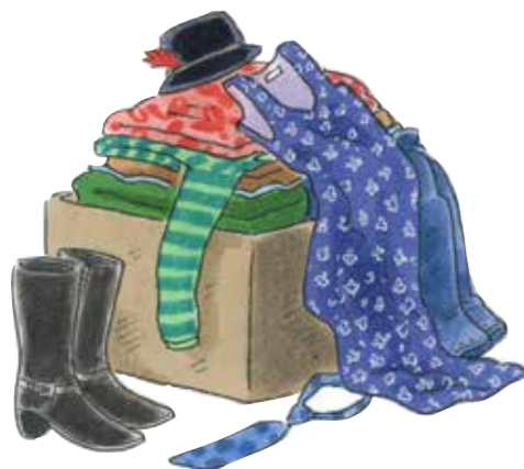
старая одежда и обувь