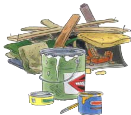
краски и строительный мусор