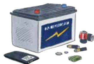
батарейки и аккумуляторы