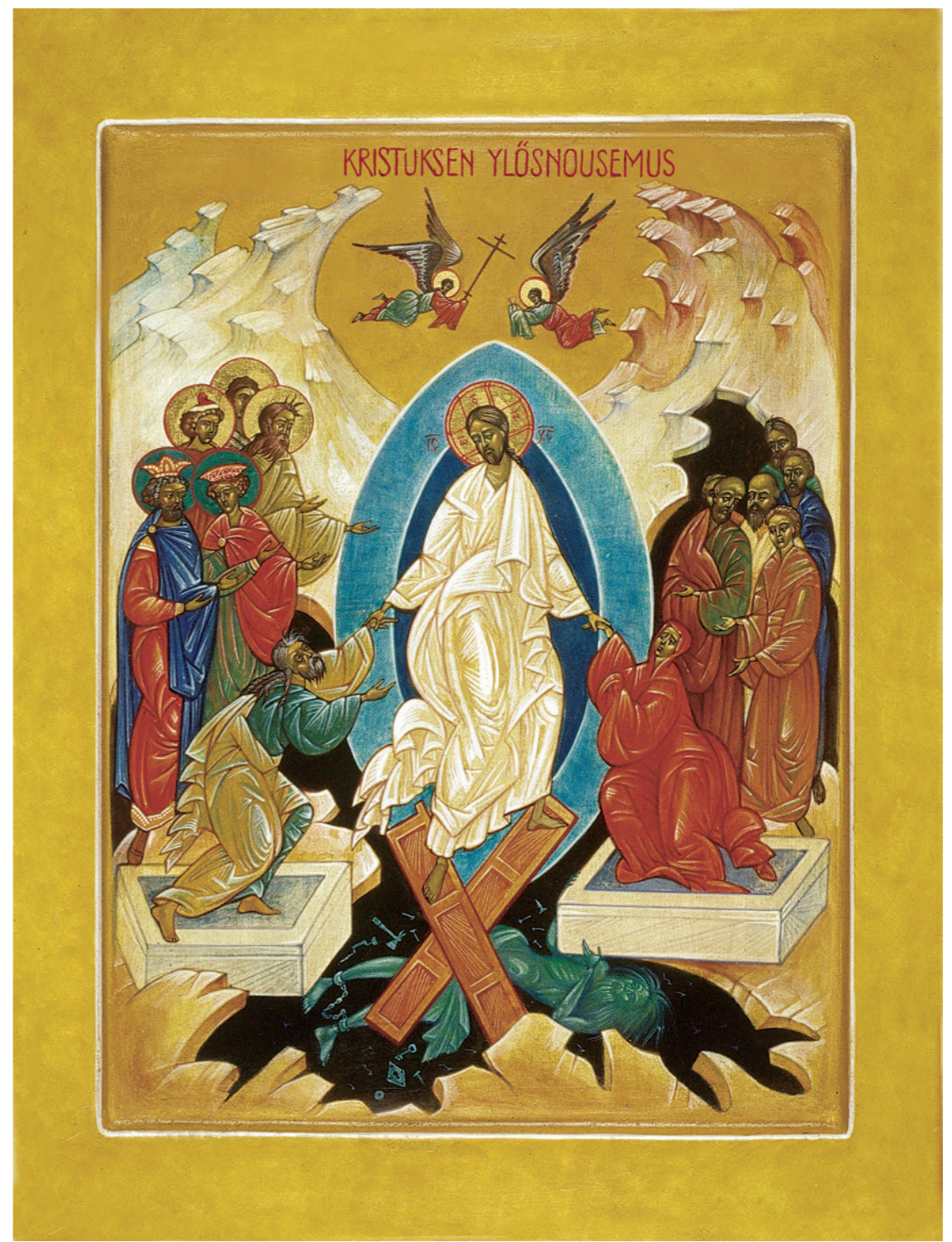
Kristuksen kuolleista ylösnousemisen ikoni. Ylösnousemussunnuntaina kirkossa lauletaan "Kristus nousi kuolleista – totisesti nousi!"

Suuren viikon sunnuntaina eli ylösnousemussunnuntaina hauta olikin tyhjä! Enkeli kehotti naisia kertomaan Jeesuksen ylösnousemuksesta opetuslapsille.